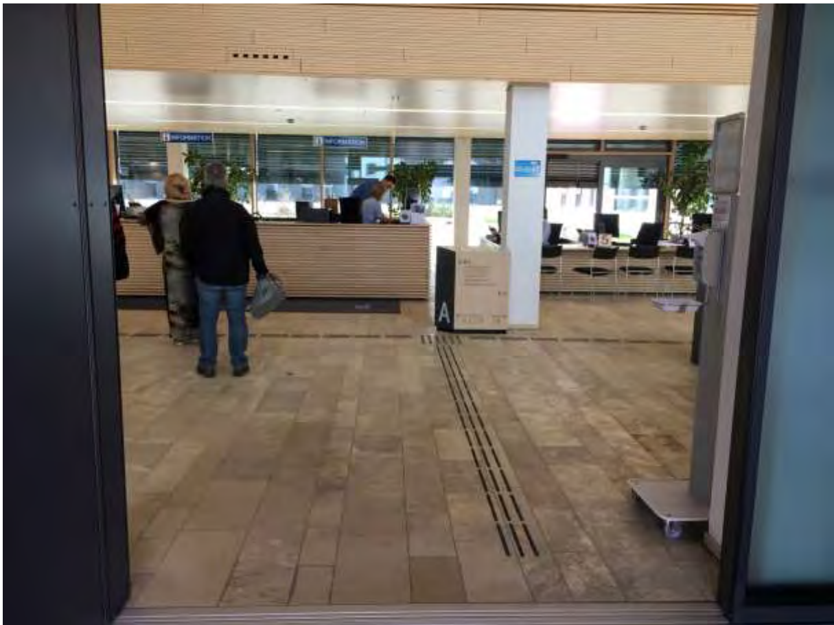
barrierefrei, April 2018